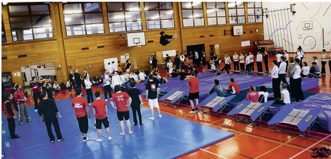
Die Gymnastrada-Gruppe des Kantons Fribourg im Training.

Weiter wurden 350 Spiele/Kämpfe ausgetragen (Fuss-, Hand- und Volleyball, Ringen), 30 Turnier-Tage organisiert (Fuss-, Hand- und Volleyball, Leichtathletik, Ringen, Schwingen, Frisbee) sowie 133 Kurse und Lager aus der ganzen Schweiz mit zirka 9'500 Übernachtungen gebucht.