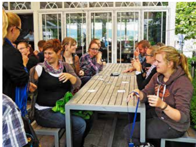
Auf der Terrasse des Brauerei-Restaurants bekamen wir Bier und Brezel serviert.

lung des Bieres, zum anderen die spannende Geschichte der Firma erzählt. Abschliessend wurden noch Bier und Brezel serviert, bevor die Gruppe wieder Richtung Bahnhof Rheinfelden aufbrach. Mit Bus und Zug ging es wieder zurück nach Willisau.