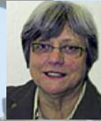
Liebe Willisauerinnen und Willisauer

In Willisau läuft etwas!! Während den Schulferien wird der Entlastungskanal in der Adlermatte gebaut. Die Strasse ist gesperrt, der Verkehr von und nach Hergiswil wird durchs Städtchen geführt. Der Strassenabschnitt Postplatz-Ettiswilerstrasse ist wieder offen. Wegen der engen Stadttore fährt der Schwerverkehr über Schlossfeld. Das nächste grosse Projekt, die «Gassensanierung», ist auch angelaufen. Am 1. Juli fand ein öffentliches Forum statt. Alle Bewohnerinnen und Bewohner waren herzlich dazu eingeladen ihre Wünsche und Anregungen zum neuen «Stadtbild» anzubringen. Die Bevölkerung wird über das Resultat informiert. Der Neubau HPS startet Ende September. Also die strategischen Aufgaben des Stadtrates gehen nicht aus.