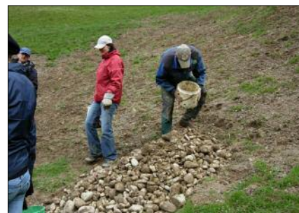
DLZ-Angestellte im Einsatz auf «Petsch»