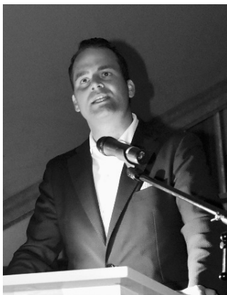
Als Festredner Ständerat Damian Müller.