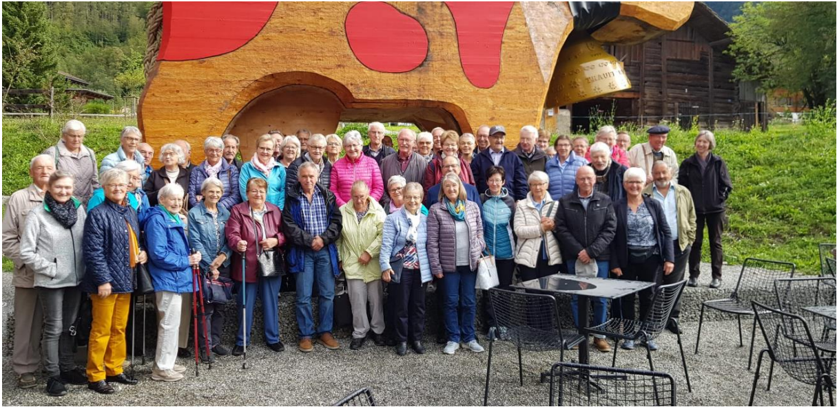
Ausflug Berner Oberland mit Besuch Trauffermuseum