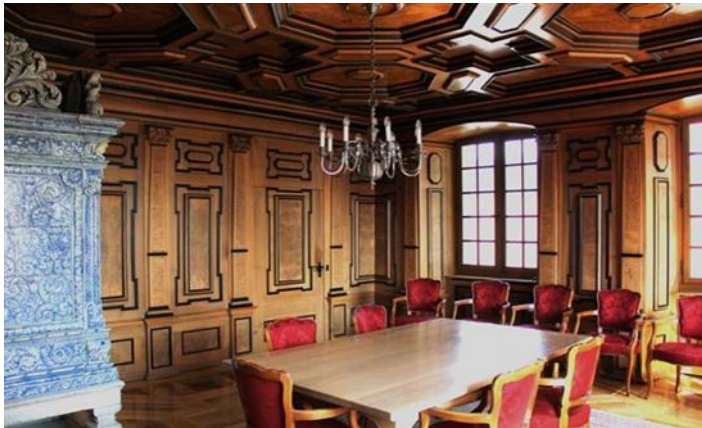
Trauungszimmer, Dachstock, Sitzplätze für 7 Gäste