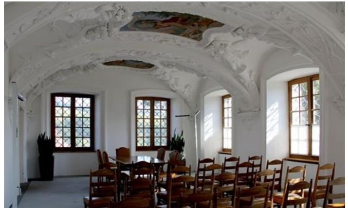
Trauungssaal, Erdgeschoss, Sitzplätze für 30 Gäste