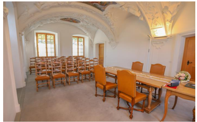
Trauungssaal, Erdgeschoss, Sitzplätze für 30 Gäste