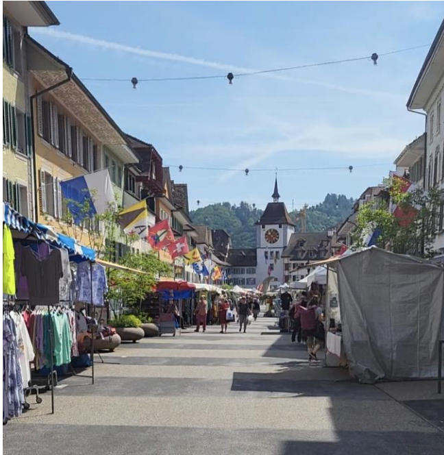
Bild: Markttreiben in Willisau